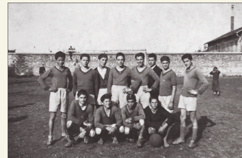
Sopra: una delle innumerevoli squadre di calcio che hanno giocato sul campo dell'Oratorio.