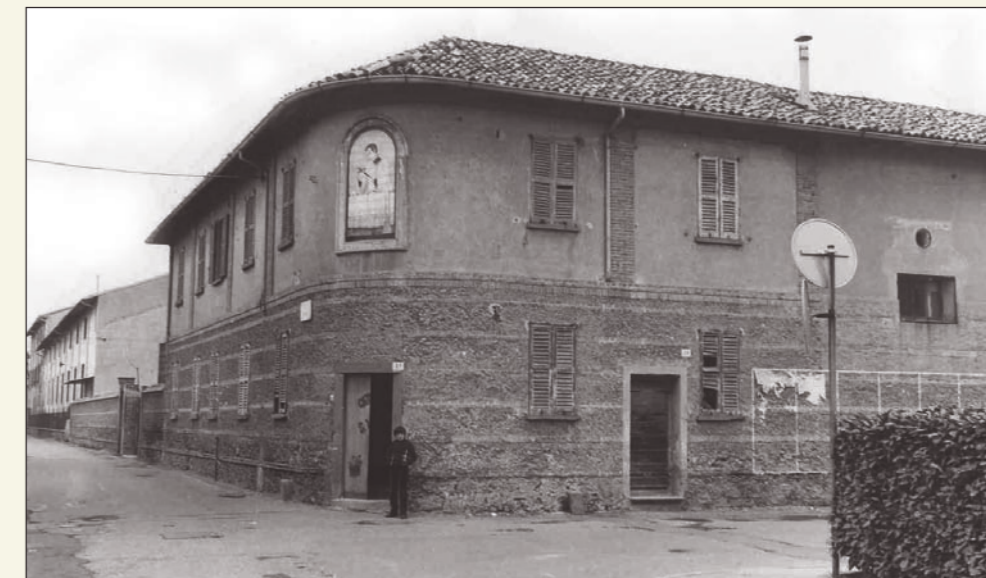
Sotto: l'entrata dell'Oratorio San Luigi all'angolo tra via Friz e via Fumagalli. Nella pagina accanto una panoramica del cortile dell'Oratorio senza la Chiesa ormai già abbattuta.