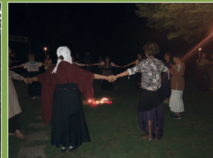
Danze durante la Camminata serale in compagnia delle streghe